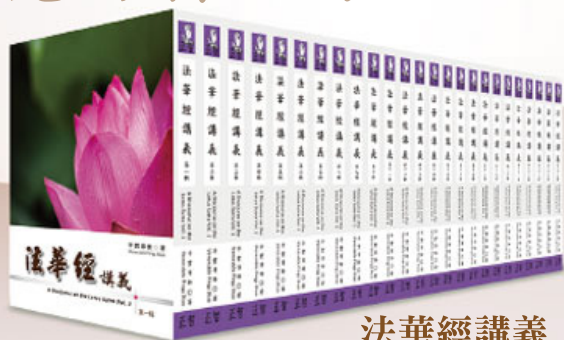
法華經講義 (全套共二十五冊)