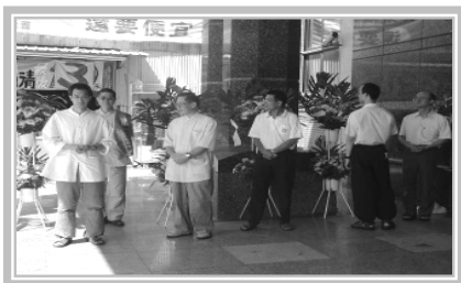
发心的师兄们引领同修菩萨入场