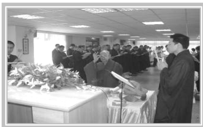
理事长 上 悟 下 圆老和尚捻香