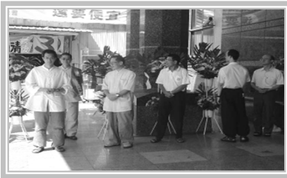
發心的師兄們引領同修菩薩入場